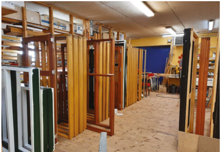
På snedkeriet fremstiller JH-Trio døre og vinduer - primært i hårdttræ - helt fra bunden.

”Vi har investeret i maskinen for at forkorte gennemløbstiden, så vi kan levere hurtigere uden at gå på kompromis med kvaliteten. Vi er stadig et snedkeri og ikke en fabrik, og maskinen skal ikke erstatte medarbejdere; for vi producerer alt fra